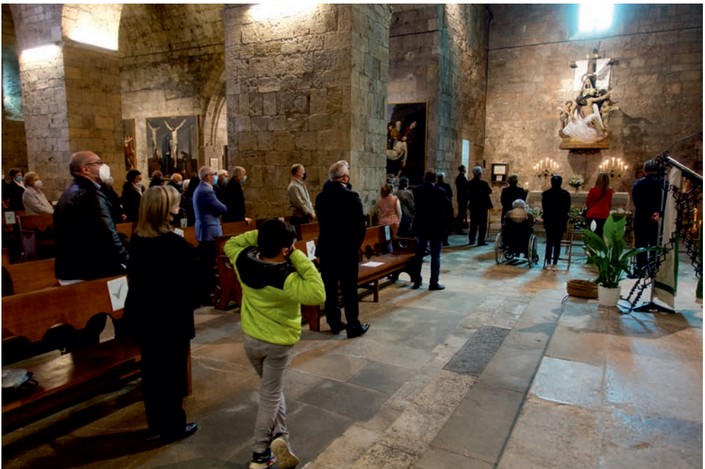
Cant de La Salve , en finalitzar la missa.