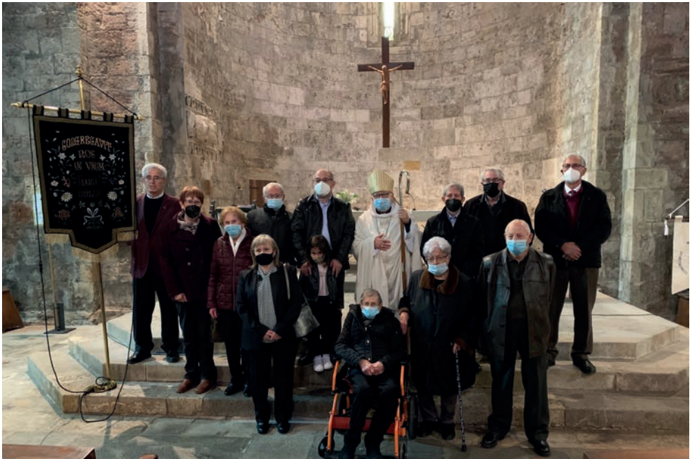
Foto de grup dels diferents Priors dels últims anys.