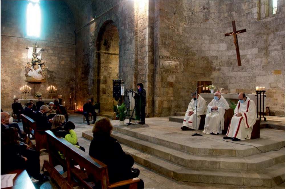
Missa de la Festivitat de la Mare de Déu dels Dolors.