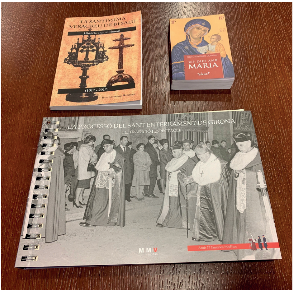
Algunes de les donacions a la Congregació efectuades els anys 2020 i 2021.

La Junta de la Venerable Congregació vol agrair de tot cor aquestes donacions, que sens dubte enriquiran el patrimoni artístic i cultural d'aquesta Congregació.