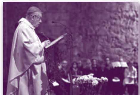
El bisbe emèrit de Girona, Monsenyor Carles Soler i Perdigó.