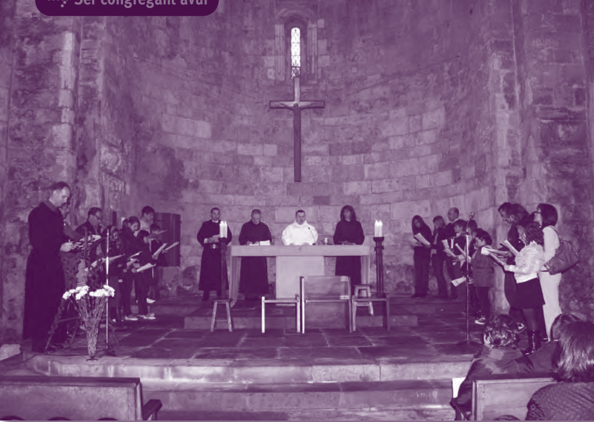
Cerimònia d'Aspirants a Congregant de 2010.

és un ritual que canvia les coses, però és una experiència que canvia la manera que tenim nosaltres de fer les coses, i és una vivència que també podem fer dins la comunitat familiar.