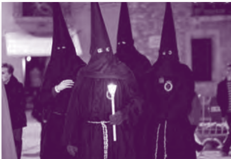
Representants de la Confraria de la Sang de Perpinyà a la Processó dels Dolors de Besalú.

– Per tal d'ajudar econòmicament a les finances de la Parròquia, la Congregació s'ha fet càrrec de la compra i el pagament de l'esmentat moble de ciris elèctrics i també d'un classificador de monedes. En aquest mateix sentit, la Junta va decidir que durant els dies del Quinari es passés la bacina cada dia, a fi i efecte d'ajudar la Parròquia en les seves necessitats.