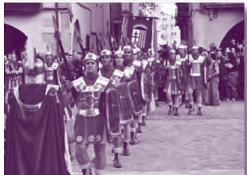
La trobada d'Amer en imatges.