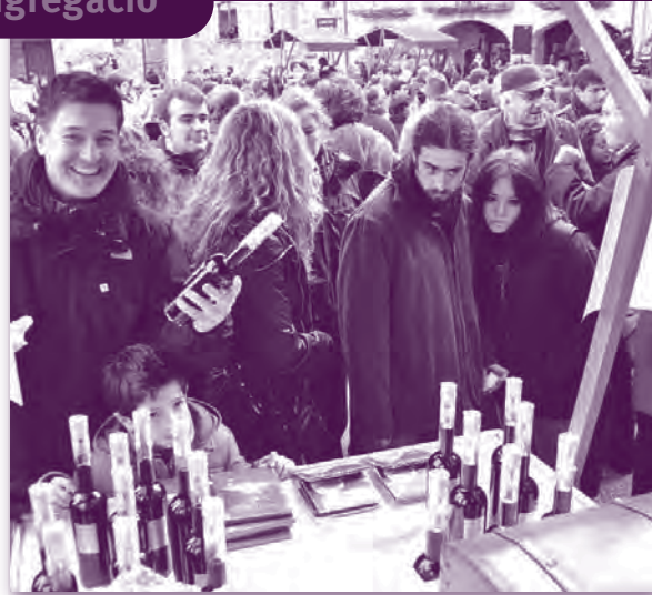
Fira de la Ratafia 2010.

que es van col·locar tot davant del Pas de la Mare de Déu dels Dolors.