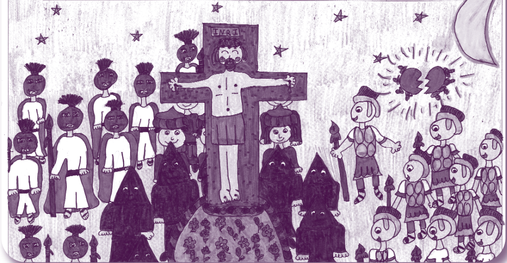
Primer premi Cicle Superior: Laia Bonada Fontanals.