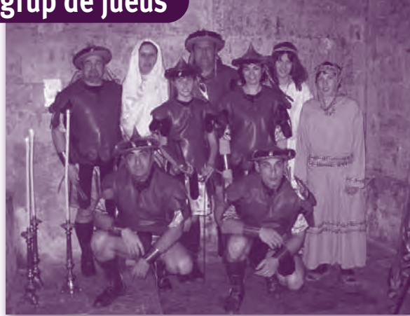
Pas de Jesús i els jueus.

La majoria dels integrants actuals del grup tenim el guardó que ens donen quan fa 15