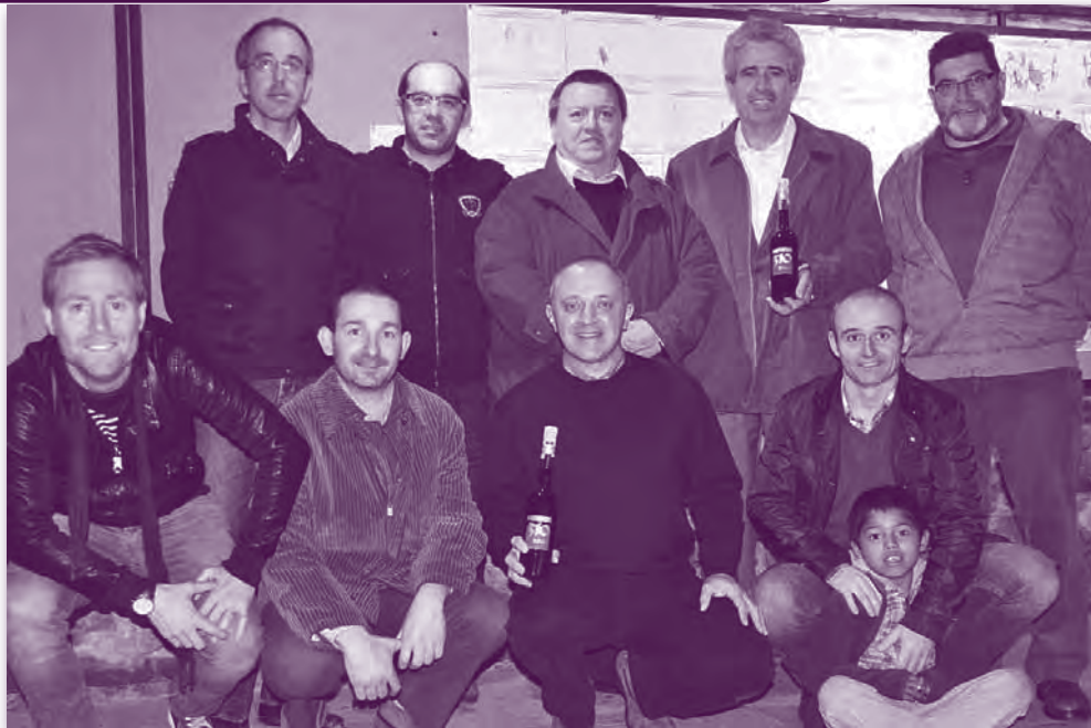
Membres de la Junta dels Dolors a la presentació de la "RATAFIA 310".

il·luminem allà on som... si no hi hagués, en aquests llocs no hi hauria llum. També ens va comentar que és important rellegir els orígens Servites per reinterpretar els temps actuals. I també ens va dir que si no ens atrevim a parlar de Déu amb la paraula, que ho fem amb els fets.